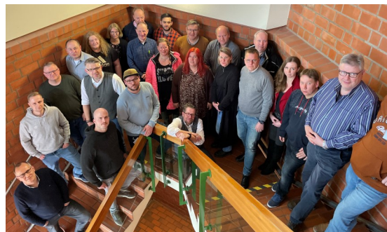
Deine NGG Tarifkommission

Die nächste Verhandlung findet am 29.03. in Zeven statt. Unterstützt eure Tarifkommission und werdet Mitglied der NGG, wenn ihr es noch nicht seid!